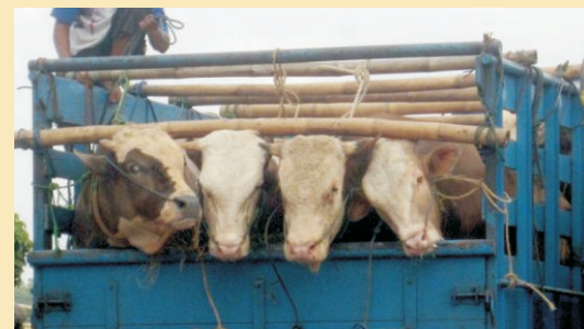
Pengangkutan sapi potong.

Hari-hari ini masih belum hilang dari ingatan kehebohan protes pemerintah dan masyarakat Australia tentang perlakuan penyembelihan sapi-sapi yang didatangkan dari Australia. Saat ini, bila kita memperhatikan fenomena disepanjang jalan, terlihat ayam-ayam yang masih hidup diikat tergantung berjejeran di sepeda motor pedagang ayam. Atau kambing yang dipaksa berdempetan di mobil pickup, bahkan ada yang mengikatnya di sepeda motor. Atau yang terjadi pada pengangkutan ternak baik ayam, kambing maupun sapi antar kota atau pulau. Semua hewan itu ditempatkan berjejeran di atas truk, kepanasan (walau mungkin sering disiram) dan kehujanan, entah diberi makan atau tidak. Bila memperhatikan foto di bawah ini sulit dipercaya sapi-sapi itu sempat diberi makan sepanjang perjalanan (karena kepalanya sulit digerakkan).